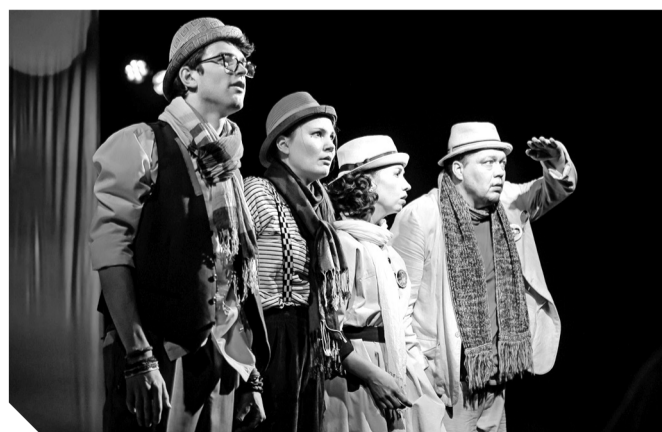
Гимназия № 3 г. Архангельска