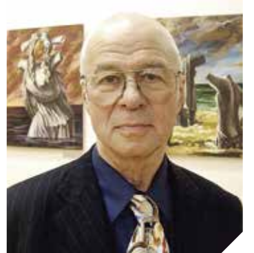
Леонид Михайлович БАРАНОВ (30 декабря 1943, Москва – 7 июля 2022, Москва) русский и советский скульптор

Очень хочется надеяться, что к следующему фестивалю науки, искусства и технологий «Ломоносов Фест» – в мае 2026 года – историческая справедливость восторжествует!