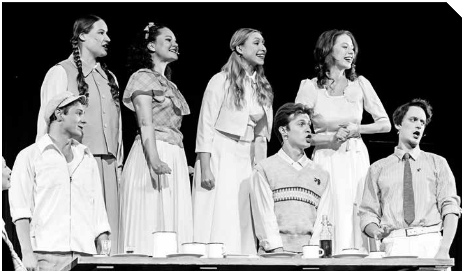
СПЕКТАКЛЬ АРХДРАМЫ «ЗАВТРА БЫЛА ВОЙНА» – ДИПЛОМАНТ «ЗОЛОТОЙ МАСКИ»!

На следующей встрече разговор пойдет о древнегреческом театре, следите за анонсами.