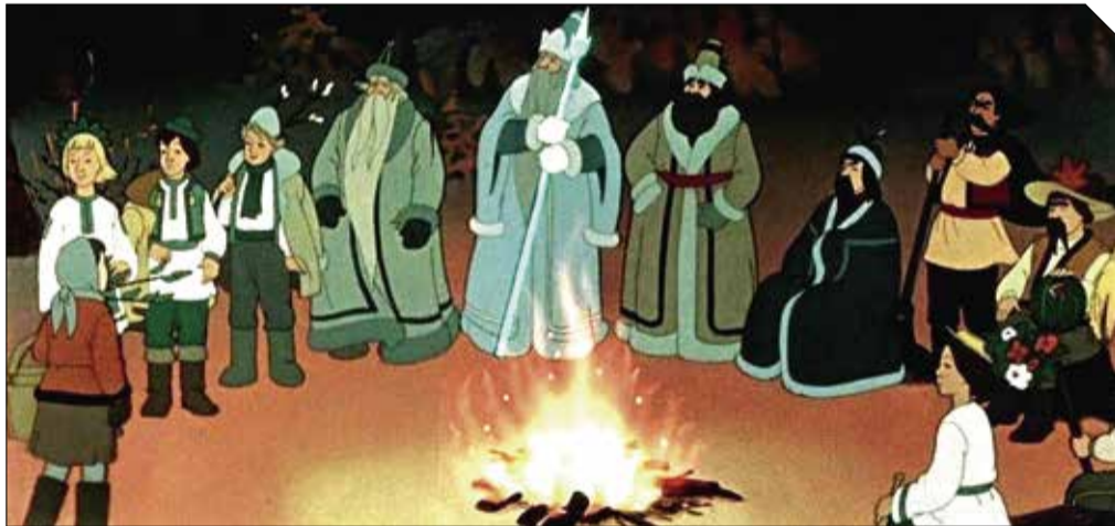
Кадр из мультфильма «Двенадцать месяцев» (режиссёры Иван Иванов-Вано и Михаил Ботов), 1956