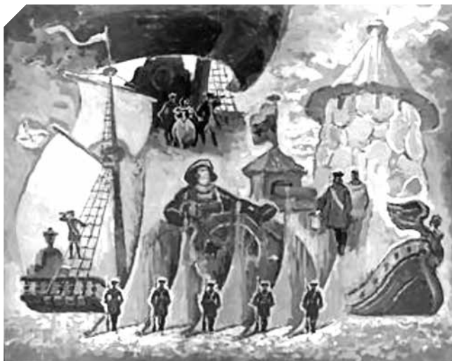
Эскиз декораций к спектаклю по пьесе Ю.П. Германа. Режиссёр В.Н. Плучек. Драматический театр Северного флота. Премьера 19.04.1945 г.

Уже вечером 22 июня артисты показывали сцены из спектаклей на мобилизационных пунктах, затем начали формировать агитбригады и выезжать с концертными программами в части архангельского гарнизона и на передовую. За годы войны на фронт ушли 82 работника театра, в том числе недавние выпускники театрального училища. Большая группа сотрудников участвовала в оборонных работах под Мурманском, где им, по сути, приходилось выживать в нечеловеческих условиях. За активный сбор тёплых вещей для солдат