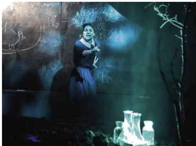
Сцена из спектакля «В лучах», Русский драматический театр имени Ф. Искандера (Сухум, Абхазия)

Несколько коллективов уже знакомы архангельским зрителям по участию в прошлых фестивалях. В прошлом году Русский драматический театр имени Ф. Искандера (Сухум, Абхазия) показал великолепный спектакль «Солярис». В интервью радио Sputnik генеральный директор театра Иракий Хинтба подчеркнул, что «приём в Архангельске был прекрасный, это были единственные на фестивале овации стоя, как нам сказали организаторы. Спектакль не короткий,