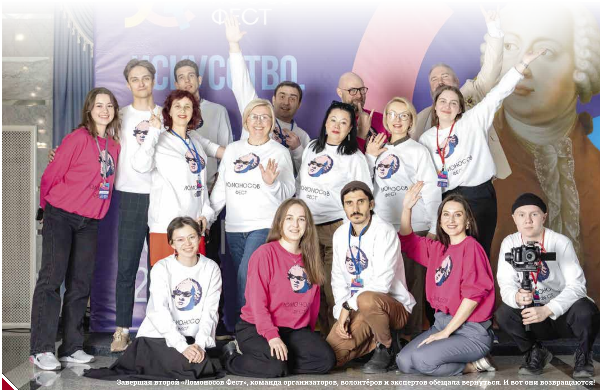
Завершая второй «Ломоносов Фест», команда организаторов, волонтеров и экспертов обещала вернуться. И вот они возвращаются!